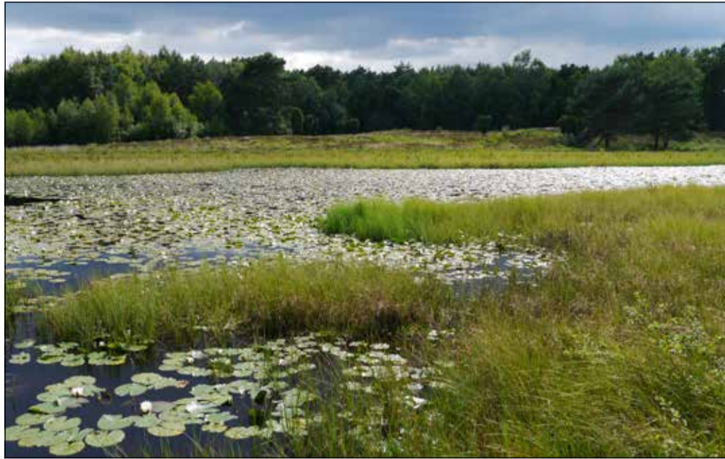
Das Blanke Flatt in der Gemarkung Vesbeck am 15. Juni 2014 ...

Wasserentnahme im Fuhrberger Feld entzieht den Wäldern die Lebensgrundlage