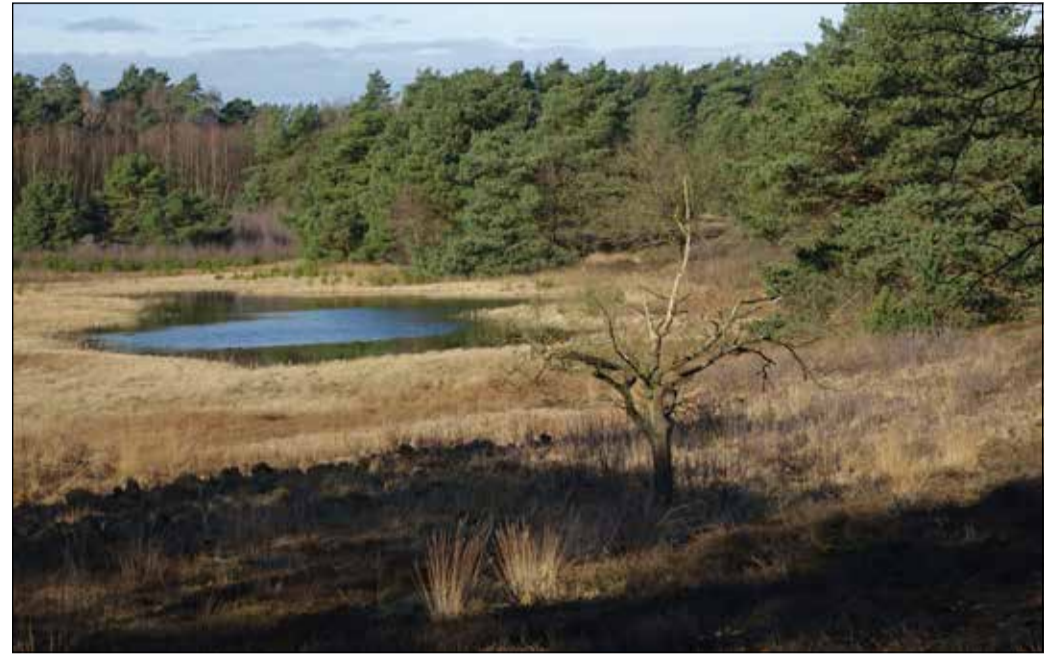
... und das selbe Gewässer im Februar 2022.