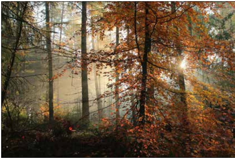
1. Sieger, Hinrich Eggers, Sonnenlicht

16 Fotos für das Landvolkhaus in Buchholz