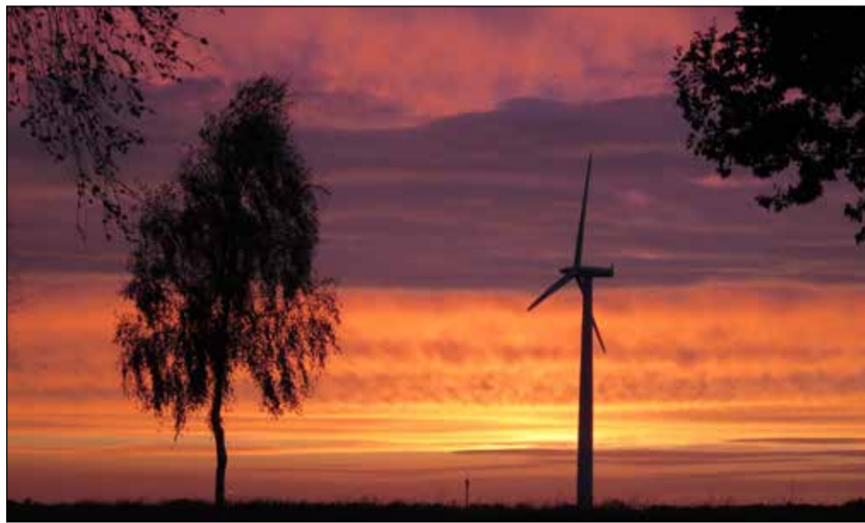
3. Sieger, Edith Schröder, Windmühlen im Abendrot bei Harmelingen

Nach dem Aufruf in unserer Zeitung hatten Leserinnen und Leser insgesamt 60 Bilder eingesandt, um an einem kleinen Fotowettbewerb teilzunehmen. Ziel war es, die schönsten Bilder auszuwählen und damit die noch kahlen Wände im Landvolkhaus in Buchholz zu verschönern. Inzwischen zierten